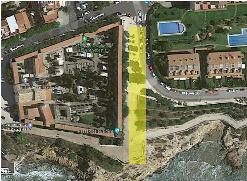
Esquema gràfic de la ubicació de l'espai FOODTASTIC.